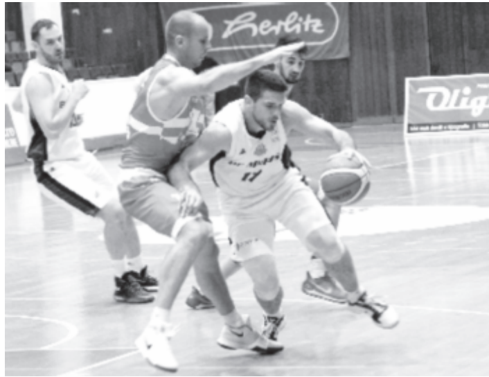
Gajovic (b) ellenfélként tért vissza a Dzsungelbe.

„Nem az a baj, ha veszítesz, de felemelt fővel kell elhagynod a játékteret – nyilatkozta a mérkőzés után Szászgáspár Barnabás vezetőedző. – Azt hiszem, el kell beszélgetnünk erről a fiúkkal. Ha vannak problémák, egymás között kell megbeszelnünk, a pályán nem szabad ennek nyoma legyen. Harcolnunk kell ezért a csodálatos szurkolótáborért. A mostani meccset kisiklásnak tekintem, remélem, a fiúk tanulnak belőle.”