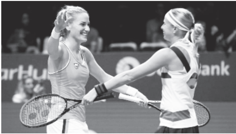
Babos Tímea és Andrea Hlavackova a szingapúri döntő győztes labdája után

Babos Tímea és Andrea Hlavackova nyerte meg a hétmillió dollár összdíjazású szingapúri tenis WTA-világajnokság páros versenyt, mivel a vasárnapi fináléban döntő rövidítésben legyőzte a holland Kiki Bertens és a svéd Johanna Larsson.