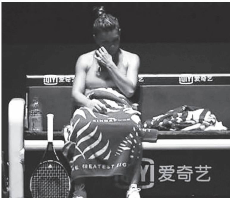
Hét percig bánkódott a búcsú miatt, aztán túltette magát rajta a világszlovák

Szingapúrban Simona Halep átvethette a Dubai Duty Free ajándékát is, amely annak a játékosnak jár, aki az első helyen zárja év végén a WTA-világranglistát, ugyanakkor megkapta a Tiffany ékszercecg gyémántgyűrűjét.